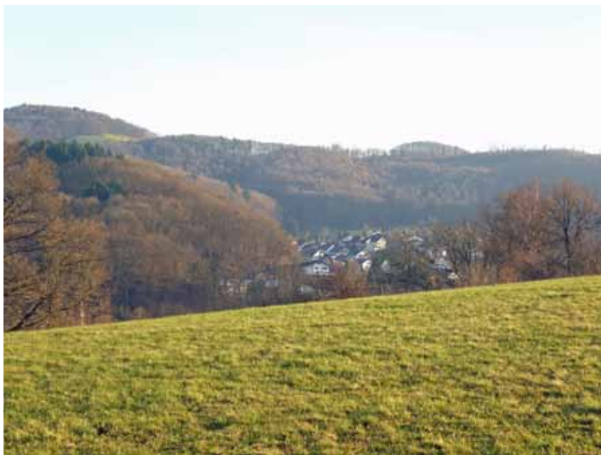
Wunderschöne Ausblicke vom Kunstweg